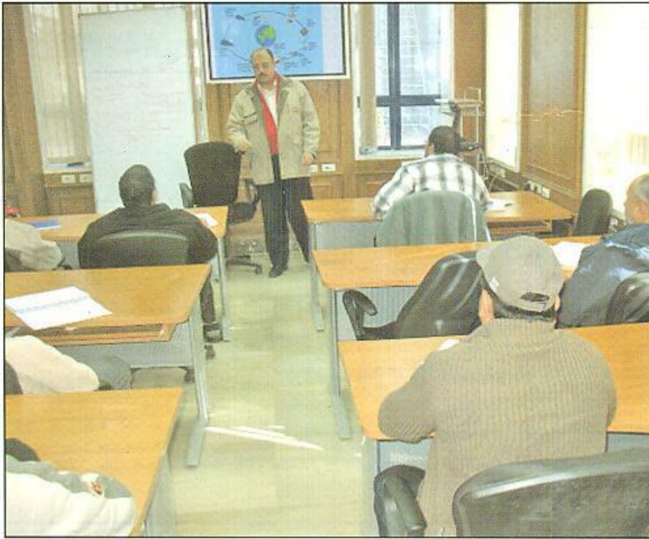
دورة إعداد متنبئ جوي لسبعة متدربين من سلطنة عمان