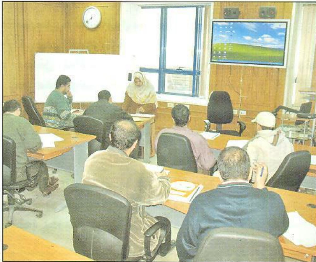
دورة مساعد فني أرصاد سينوبتكية لثمانية متدربين من مصر وعمان

أرصاد سينوبتكية ، يحضر الدورة دارس واحد من سلطنة عمان برسوم تدريب ٢٢٠٠ دولار أمريكي بالإضافة إلي سبعة دارسين من الهيئة . - يعقد خلال الفترة من أول يناير حتي ٣٠ يونيو ٢٠٠٨ دورة إعداد راصد جوي لثلاثة دارسين من سلطنة عمان برسوم تدريب قدرها ٧٥٠٠ دولار أمريكي ، بالإضافة إلي دارس واحد من الهيئة .