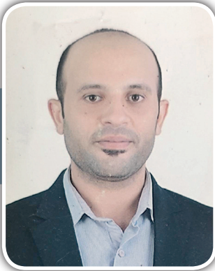
إعداد: د. محمود سامي محمود لاشين