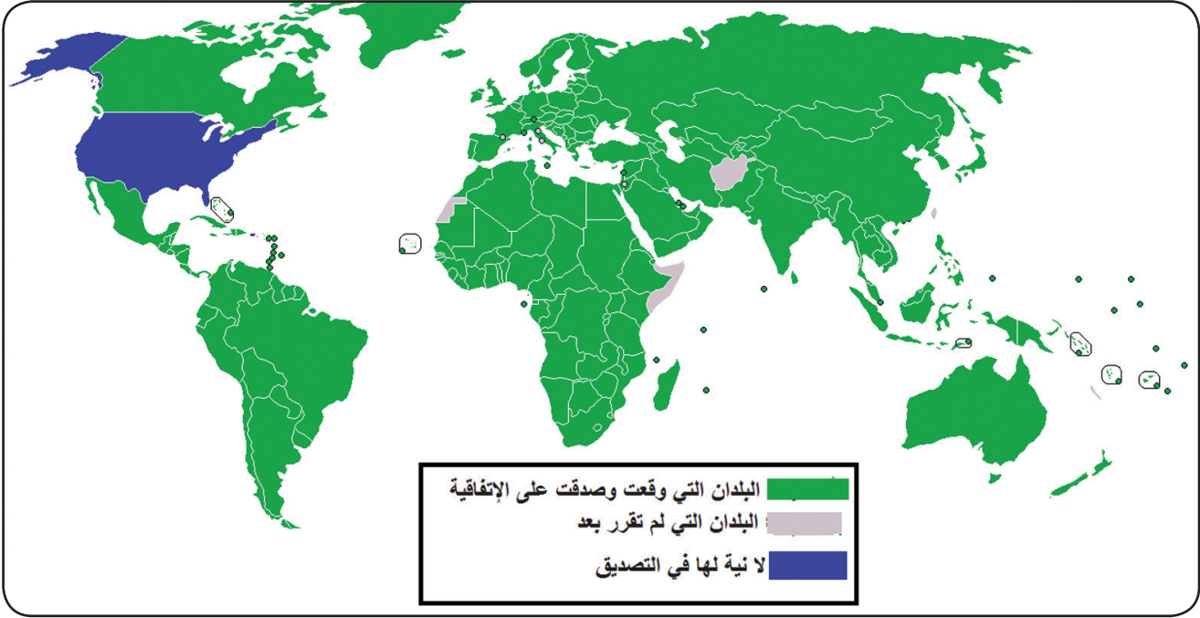
شكل (٢) الدول التي وقعت وصدقت على إتفاقية كيوتو ٢٠٠٩ م