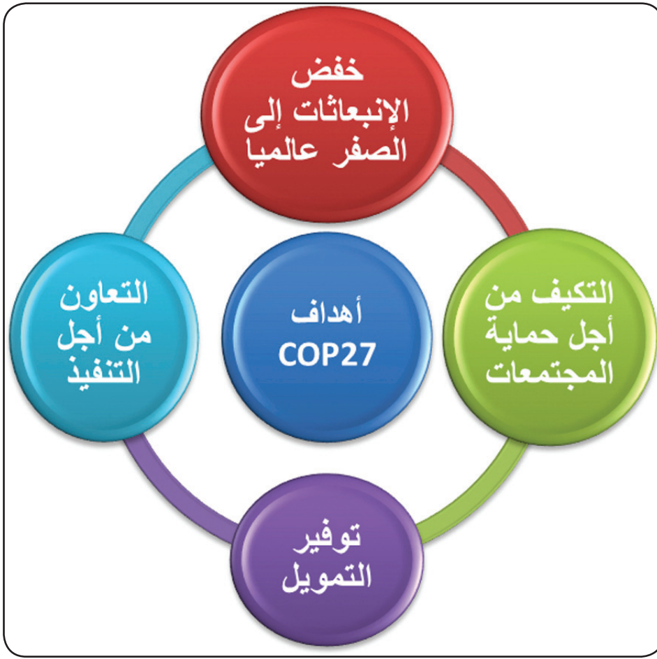
شكل (٣) القضايا التي تناقشها قمة المناخ

المناخ على حماية وترميم أنظمتها البيئية ووضع أنظمة إنذار لجعل البني التحتية والزراعية أكثر صموداً لتفادي الخسائر في الأرواح والممتلكات ومصادر الدخل.