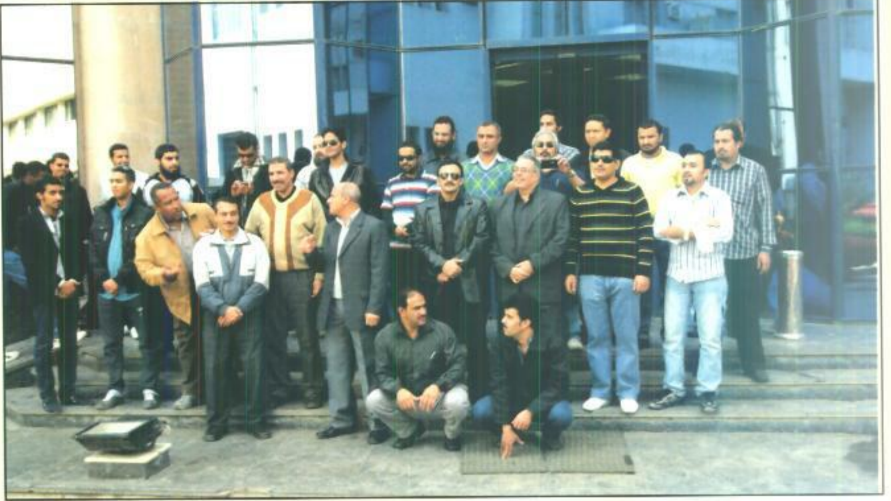
المتدربون من المملكة العربية السعودية مع مدربي المركز

٢١/١١/٢٠١١ وكان في استقبال سيادته قيادات الهيئة حيث تم عمل اجتماع ترحيبي بسيادته تم خلاله مناقشة القضايا الفنية والتي هي محل اهتمام كل من المنظمة العالمية للأرصاد الجوية والهيئة. ثم قام سيادته بزيارة بعض مرافق الهيئة وكان أولها مركز القاهرة الإقليمي للتدريب والبرامج التدريبية المنعقدة حالياً ويوجد به حالياً عدد ١٦ راصد جوى من الكوادر الفنية من الرئاسة العامة للأرصاد وحماية البيئة بالمملكة العربية السعودية للتدريب في المركز في دورة تنشيطية لمدة ٨ أسابيع بهدف تنمية مهاراتهم ورفع مستوى أدائهم في مجال الرصد الجوى وذلك ضمن بروتوكول تعاون لمدة سنتين يشمل تدريب