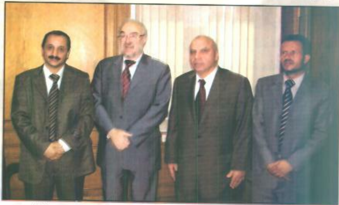
نائب مدير الأرصاد اليمنية الذي تصادف وجوده بمركز التدريب الإقليمي مع السيد سكرتير عام المنظمة والسيد رئيس مجلس الإدارة

ثم قام سيادته بزيارة مركز القاهرة الإقليمي لمعايرة الأجهزة وقام بالاطلاع على