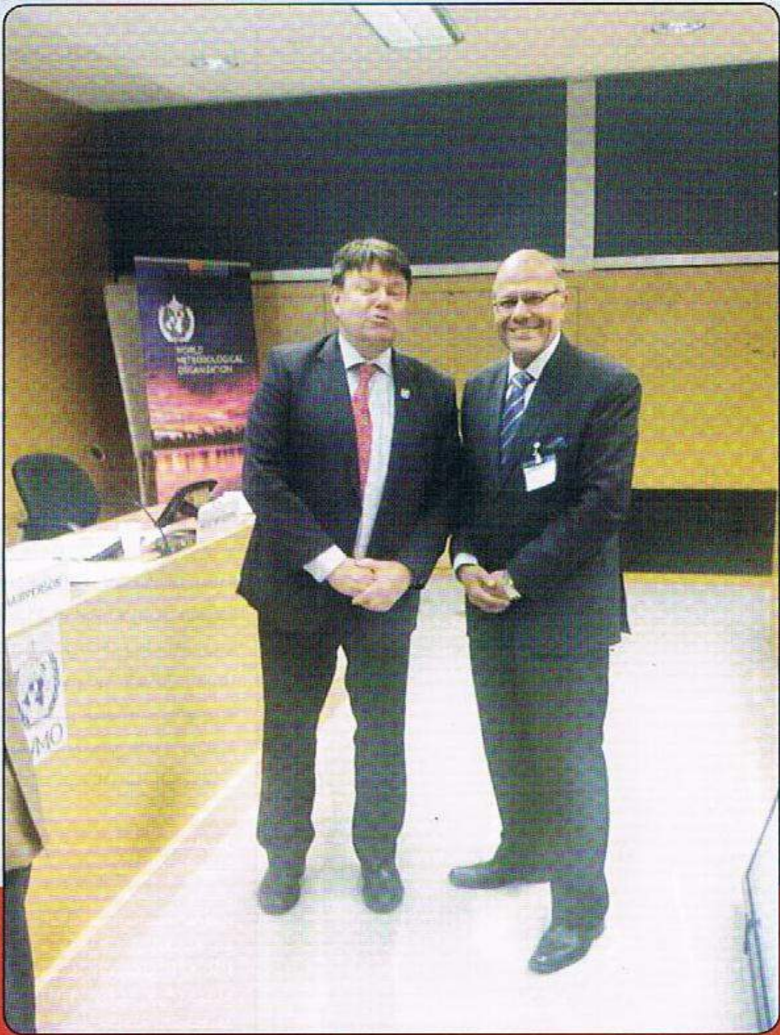
لقاء الدكتور أحمد عبدالعال مع أمين عام المنظمة العالمية للأرصاد الجوية السيد بيري تالاس خلال الفترة من ١١ - ١٧/١٠/٢٠١٧ بجنيف بسويسرا