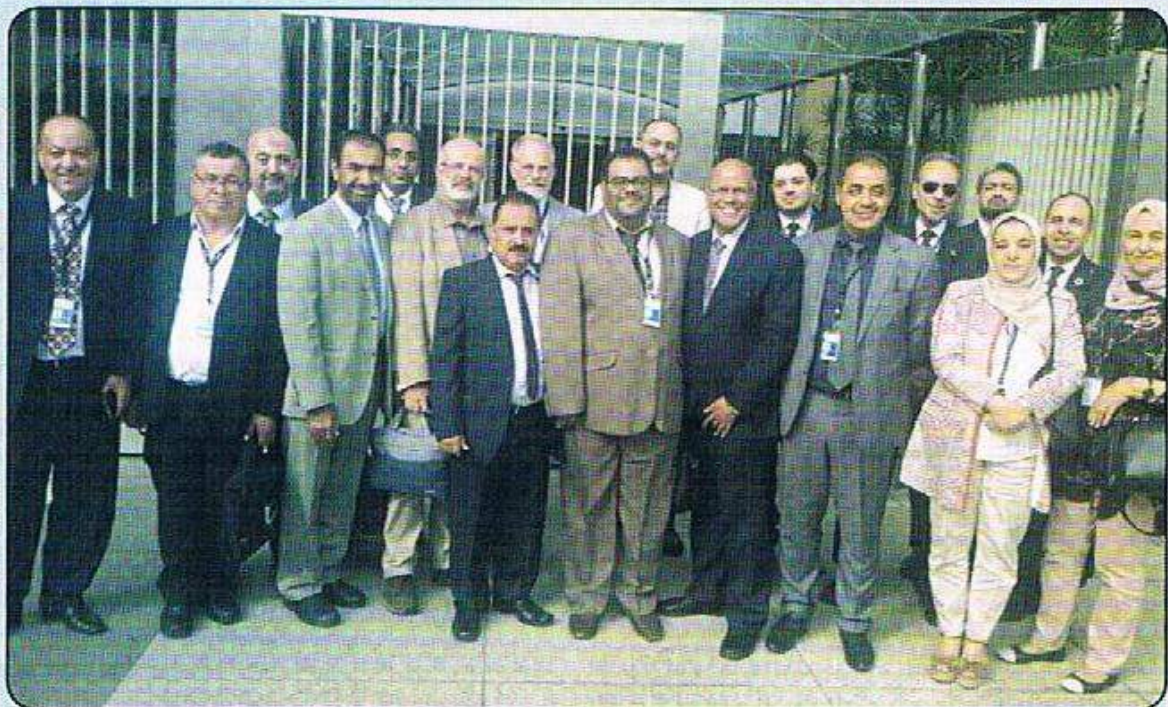
السيد الدكتور أحمد عبدالعال رئيس الهيئة والوفد المشارك في فاعليات المؤتمر الرفيع المستوى ببيروت