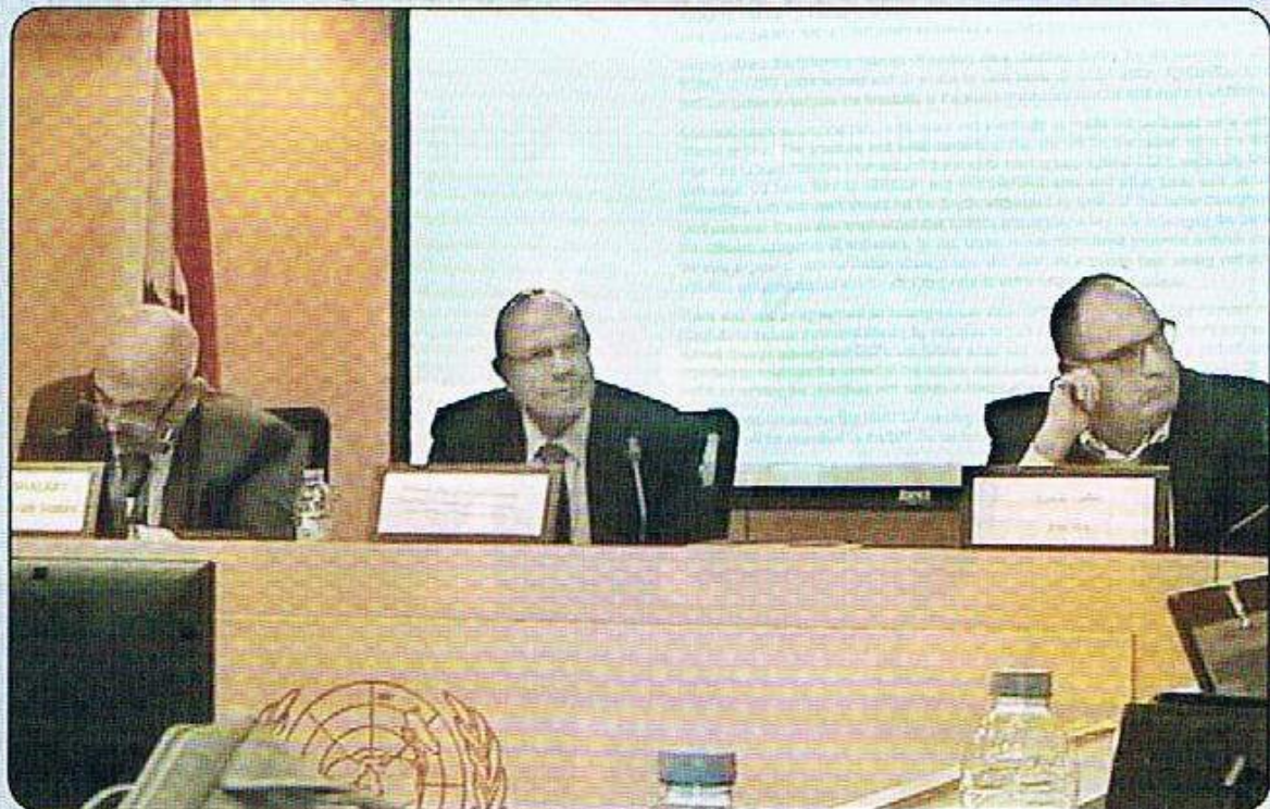
احدي الاجتماعات الجانبية خلال فاعليات المؤتمر الرفيع المستوى